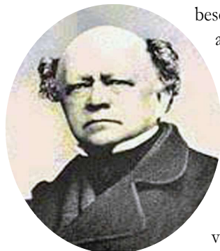
Ludwig van Köchel

Je vraagt je wel eens af waar de titel van een compositie vandaan komt. Soms blijkt het om de naam van een persoon te gaan zoals bij Goldbergvariaties van Johann Sebastian Bach of de Kreutzersonate van Ludwig van Beethoven. Bekende composities. Andere composities worden vernoemd naar een land of streek, zoals de Schotse Fantasie van Max Bruch en De Hebriden van Felix Mendelssohn-Batholdy. En wat te denken van de balletten De os op het dak van Darius Milhaud en Het sluwe vosje van Leos Janáček. Hier zijn sprookjes de naamgevers. Maar evenzeer kan een verhaal uit de Bijbel, de Mythologie of het werk van een dichter of schrijver zoals William Shakespeare of Johann Wolfgang von Goethe de inspiratiebron zijn. De Mondscheinsonate van Beethoven heet zo, omdat een recensent de muziek ooit