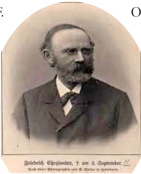
Dr. Friedrich Chrysander.

Ook op dynamische begrippen als forte, pianissimo, allegro, fermate, (di)minuendo en sostenuto etc. wordt hier niet verder ingegaan.